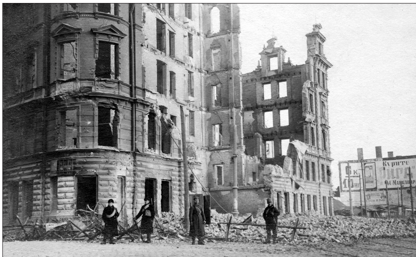
Latvijas armijas karavīri pie kāda sagrauta daudzstāvu nama. Iela bijusi aizsprostota ar dzeloņdrāšu aizžogojumu. Rīga, 1919. gada novembris