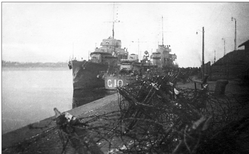
Lielbritānijas karakuģi Daugavā. Rīga, 1919. gada novembra vidus