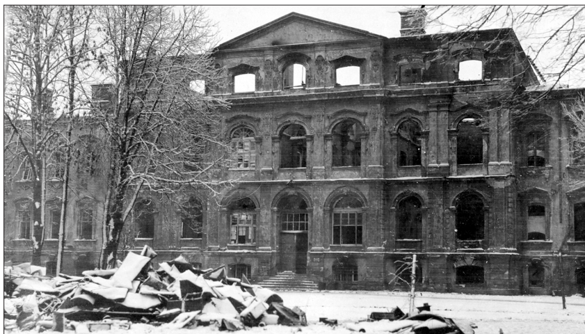
1919. gada 21. novembrī Latvijas armija atbrīvoja Jelgavu. Pirms došanās prom bermontieši nodedzināja Jelgavas pili. Nopostītās Jelgavas pils centrālās daļas fasāde. 1919. gada novembra beigas