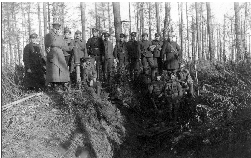
1919. gada vasaras beigās, gatavojoties iespējamam Rietumu brīvprātīgo armijas (bermontiešu) uzbrukumam, Latvijas armijas (LA) vienības ieņēma pozīcijas Rīgas pievārtē. LA Vidzemes divīzijas karavīri. Rīgas apkārtnē, 1919. gada rudens