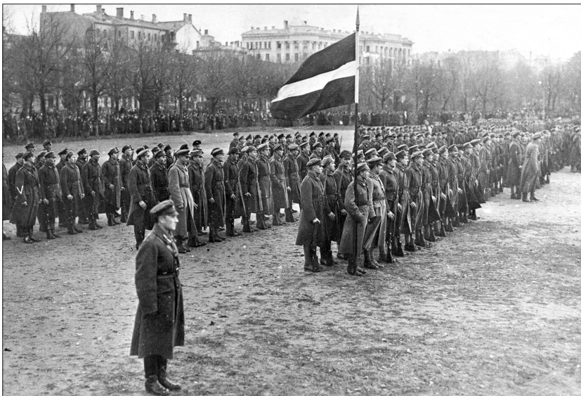
Godinot Latvijas Atbrīvošanas cīņu dalībnieku piemiņu, 11. novembris kļuva par Lāčplēša dienu . Latvijas armijas karavīri Lāčplēša dienas parādē. Rīga, Esplanāde. 1920. gada 11. novembris