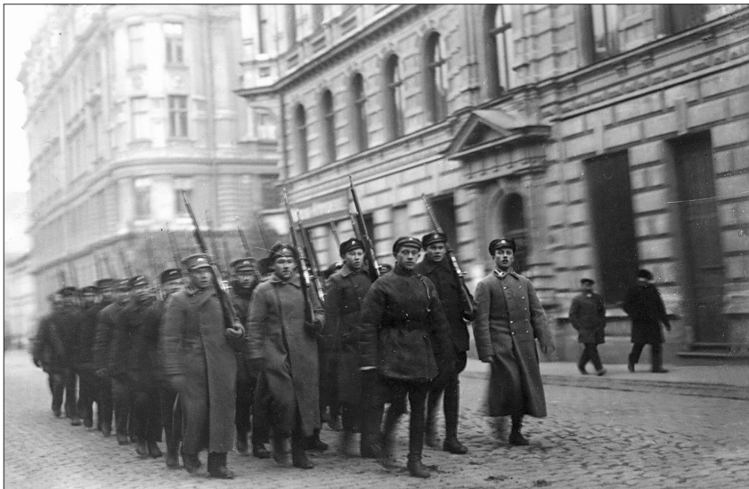
1919. gada 3. novembrī sākās Latvijas armijas uzbrukums, kura mērķis bija atbrīvot visu Pārdaugavu. LA Bruņotā divīziona karavīri dodas uz fronti. 1919. gada 9. novembris