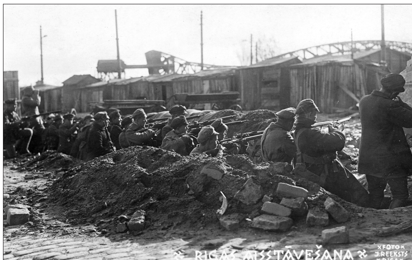
Latvijas armijas vienības, nespēdamas noturēt frontes līniju, atkāpās Rīgas virzienā. 10. oktobra agrā rītā pēdējās rotas šķērsoja tiltus pār Daugavu un nostiprinājās tās krastā. Latvijas armijas karavīri ierakumos. Daugavmala, 1919. gada oktobris – novembris