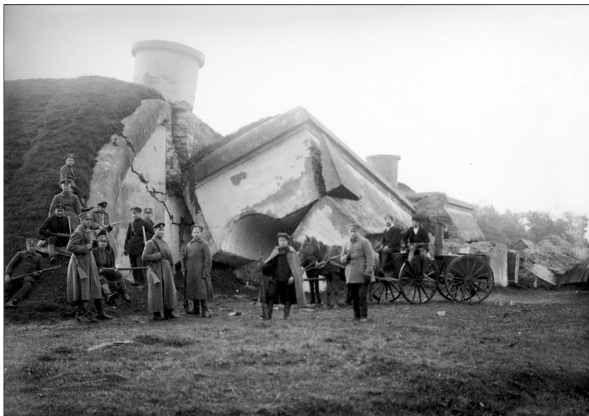
Laikā, kad norisinājās kaujas par Rīgu, bermontieši mēģināja ieņemt arī Liepāju. Latvijas armijas Lejaskurzemes kara apgabala karavīri pie lauka virtuves. Liepāja, Kara osta. 1919. gada novembris