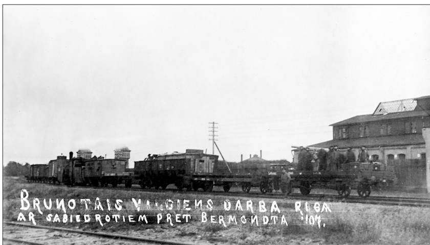
Latvijas armijas I bruņuvilciens. Uz platformas no Lielbritānijas karakuģa noņemts lielgabals un tā apkalpe. 1919. gada novembra beigas