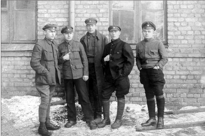
1919. gada 26. novembrī Latvijas armijas vienības sasniedza Lietuvas robežu, ar to arī noslēdzās cīņas pret bermontiešiem. LA 5. Cēsu kājnieku pulka karavīri. 1919. gada novembra beigas