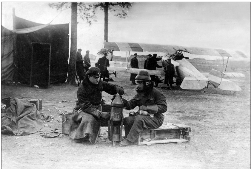
LA Aviācijas nodaļas karavīri gatavojas kaujas lidojumam. Krustabaznīcas aerodroms, 1919. gada oktobris