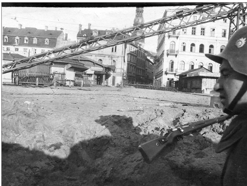
Rīgā mēnesi ilga artilērijas apšaudes un kaujas. To laikā cieta neskaitāmas ēkas. Skats no ierakumiem uz apšaudēs cietušajām Vecrīgas ēkām. Grēcinieku iela, 1919. gada novembra sākums