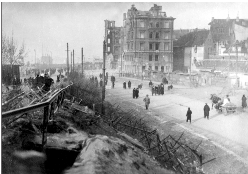
Pēc bermontiešu padzišanas no pilsētas rīdzinieki dodas apskatīt Vecrīgu un Daugavmalu. Artilērijas apšaudē sagrautie nami Kārļa ielā (tag. 13. janvāra iela). 1919. gada 12. novembris