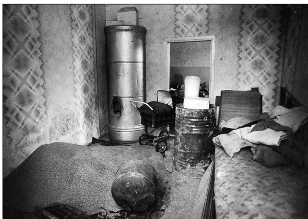
7. Dzīvoklis "Aučos" 1991. gadā. Istabā sabērti graudi