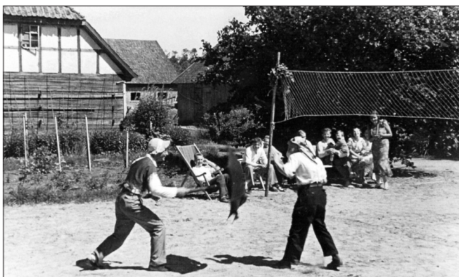
4. Sporta spēles “Aučos” 20. gs. trīsdesmitajos gados

forsēt Lielupi un padomju filmās braši sita vāciešus. Sapratu arī, ka attēlos redzamie valstsvīri nav tā smaidīgā onkuļa, kurš vērās pretī no ābece pirmās lapas, draugi vai cīņu biedri.