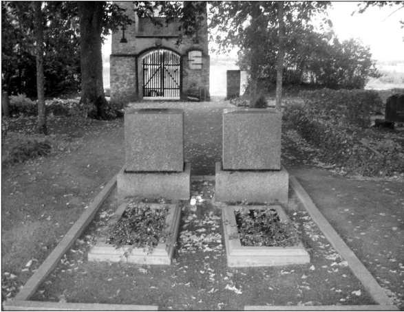
9. Jāņa Čakstes vecāku Krišjāņa Čakstes un Karolīnes Matildes Čakstes kapavieta Igauņu kapsētā Sidrabenes pagastā mūsdienās