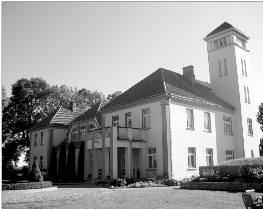
8. “Auči” šodien