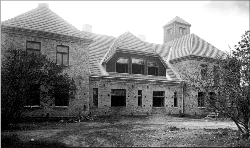
1. "Auči" 20. gs. trīsdesmitajos gados