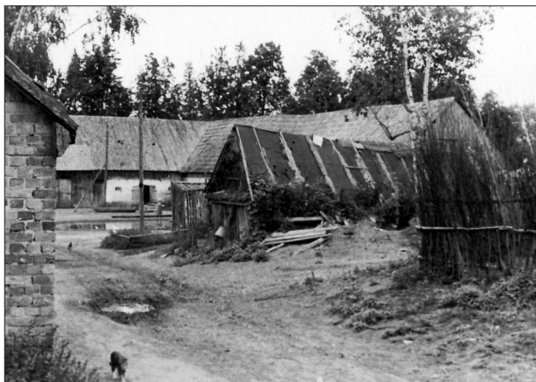
5. Saimniecības ēkas "Aučos". 20. gs. 40. gadu otrā puse