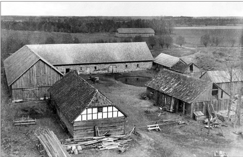
2. "Auču" saimniecības ēkas 20. gs. trīsdesmitajos gados

neliecināja, ka varētu kaut kur braukt. "Rīga" izrādījās milzīga grāmata "Latvijas pilsētas valsts 20 gados" (1938). Es biju apķērīgs zēns un sapratu, ka tie kareivji, kuri redzami gleznu reprodukcijās, nav no tās pašas armijas, kuras pārstāvji katru gadu pretī Emburgai mācījās ar tankiem