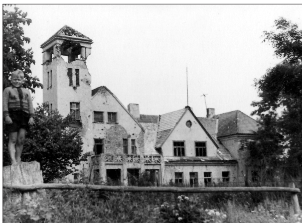
6. "Auči" 1946. gadā