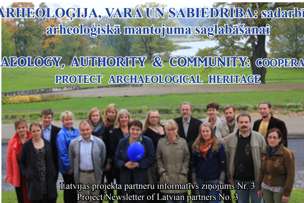
Latvijas projekta partneru informatīvs ziņojums Nr. 3 Project Newsletter of Latvian partners No. 3

Ar 2012. gada 1. maiju Igaunijas – Latvijas – Krievijas Pārrobežu sadarbības programmas Eiropas kaimiņattiecību un partnerības ietvaros 2007 – 2013 tiek īstenots projekts „Arheoloģija, vara un sabiedrība: sadarbība arheoloģiskā mantojuma saglabāšanai”.